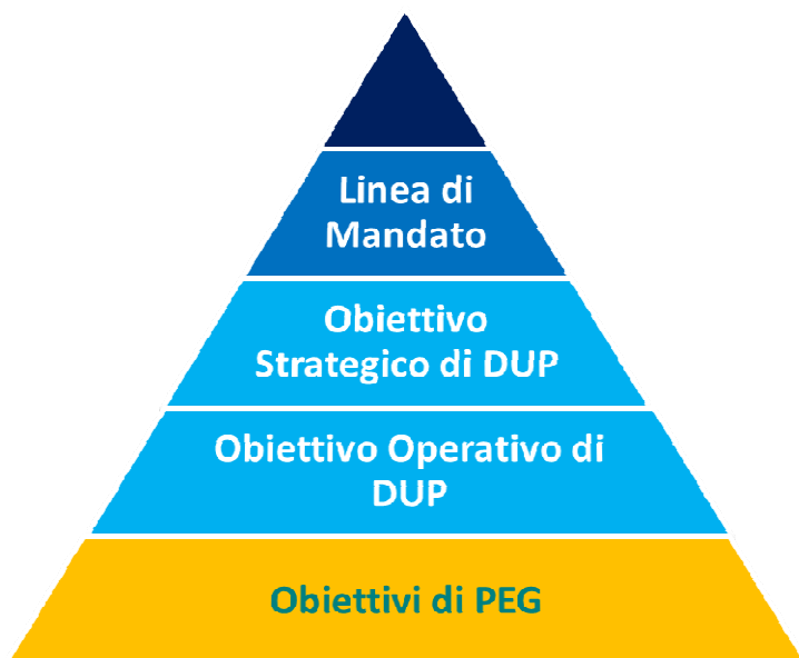
Il Modello di albero della performance dell'Unione Valle Savio

La misurazione della performance, sia essa individuale, organizzativa o di ente, avviene attraverso la valorizzazione del sistema di indicatori sottostante all'albero della performance.